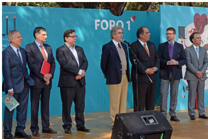
Rafael Tovar y de Teresa, presidente del CONACULTA destacó la importancia de la 34 edición de la Feria Internacional del Libro Infantil y Juvenil (FILIJ), que inauguró este viernes 7 de noviembre.

“Por primera vez se ha creado una Sala de Lectura Interactiva que permitirá a los niños y jóvenes una inmersión a los distintos lenguajes que nos ofrecen ahora las diferentes herramientas tecnológicas. Yo los invito a todos a adentrarse al mundo de las páginas y las palabras que es lo que nos ofrece un libro y que es un medio para cambiar nuestras vidas”, agregó el titular del CONACULTA en el acto previo de corte de listón inaugural de la FILIJ en las Áreas Verdes del CENART.