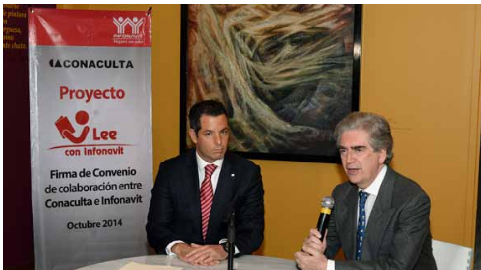
Alejandro Murat Hinojosa y Rafael Tovar y de Teresa, durante la firma del convenio de colaboración Lee con el INFONAVIT.

Consideró que este esfuerzo debe ampliarse a todo el país y al mayor número de unidades habitacionales, a fin de que éstas se conviertan en espacios