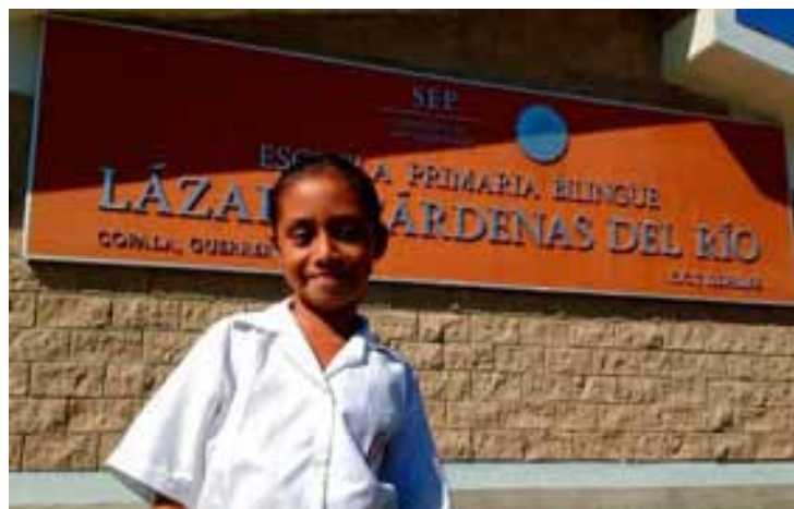
Plan Nuevo Guerrero.

El Subsecretario de Desarrollo Comunitario y Participación Social de la Secretaría de Desarrollo Social, informó que también dentro de todos los trabajos, se están sentando las bases para realizar un gran plan de alfabetización en diferentes zonas de Guerrero, que llegará a las zonas más alejadas de la entidad.