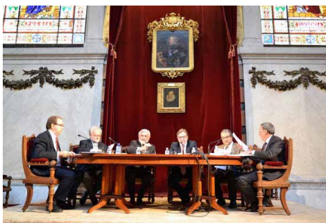
Mesa de clausura del Simposio El futuro de los diccionarios en la era digital.